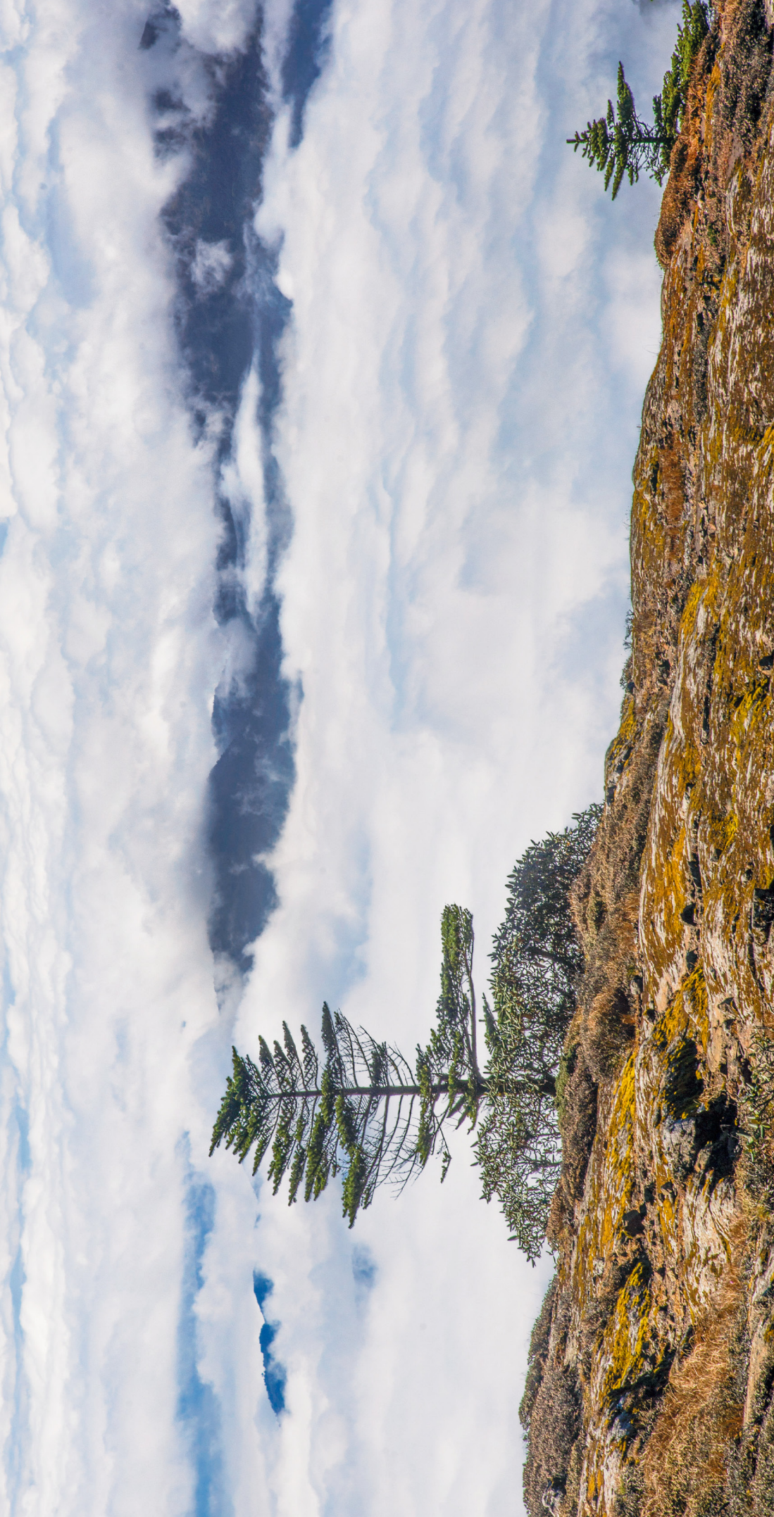
轿子雪山云海